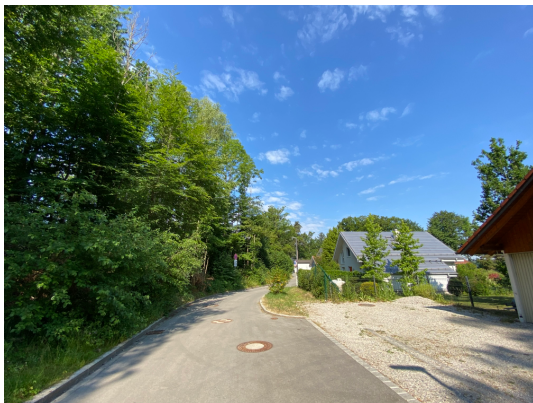
Abb. 4: Wörthseestraße im Norden, Blick von Ost nach West.