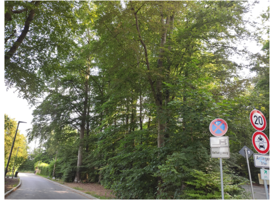
Abb. 3: Waldfläche auf Fl.Nr. 470/31.