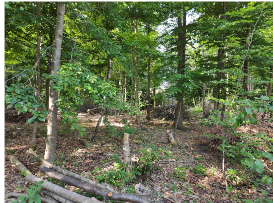
Abb. 9: Waldbestand innerhalb des Planungsgebietes.