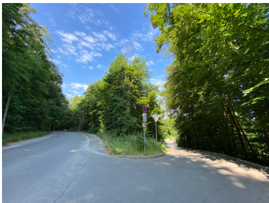
Abb. 6: Gabelungsbereich der Wörthseestraße. Im Zentrum: Waldfläche (Fl.Nr. 470/71).