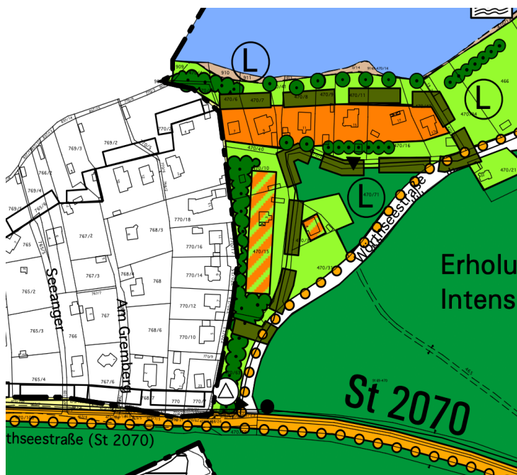
Abb. 1: Ausschnitt aus dem Flächennutzungsplan der Gemeinde Seefeld (Stand: 20.06.2006).

Der vorliegende Bebauungsplan kann mit den vorgesehenen Festsetzungen nicht aus dem Flächennutzungsplan entwickelt werden. Es ist eine Änderung des Flächennutzungsplans notwendig.