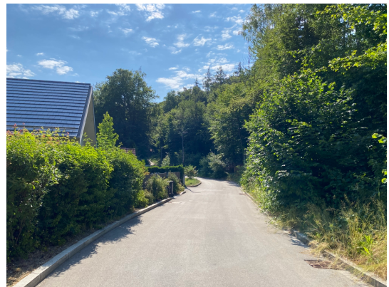
Abb. 5: Wörthseestraße im Norden, Blick von West nach Ost. Waldfläche rechts der Straße.