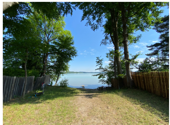
Abb. 7: Öffentlicher Zugang zum Wörthsee.