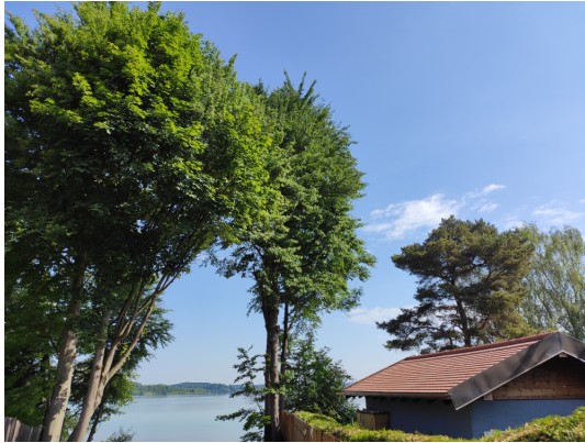
Abb. 2: Baumbestand im Uferbereich im nordwestlichen Teil des Planungsgebietes.